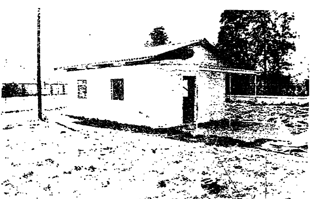
مستوصف دون حركة